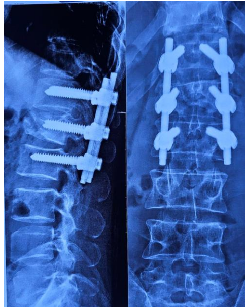
Рис. 2. Рентгенография груднопоясничного отдела позвоночника в двух проекциях через 12 месяцев. Сохраняется правильное положение оси позвоночника, признаков формирования кифотического угла не выявлено.

сопутствующих повреждений, исходный и послеоперационный неврологический статус, а также наличие осложнений. В процессе динамического наблюдения фиксировались ограничения движений и выраженность болевого синдрома (оценивалась по визуальной аналоговой шкале, VAS).