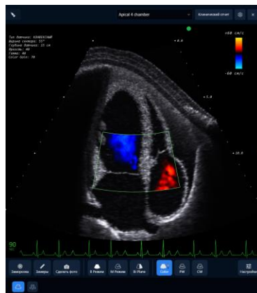
Рис.4. изображение протекание крови в предсердие и желудках сердца на симуляторе. (Эффект Доплера)

Виртуальный симулятор охватывает широкий спектр патологий и клинических сценариев, предлагая комплексный опыт обучения. Студенты могут попрактиковаться в обнаружении аномалий, таких как опухоли, кисты или сердечные аномалии, и научиться отличать их от нормальной анатомии. Симулятор также может моделировать сложные сценарии, в том числе пациентов с ожирением или сложные положения датчиков, подготавливая стажеров к реальным задачам (рис.4).