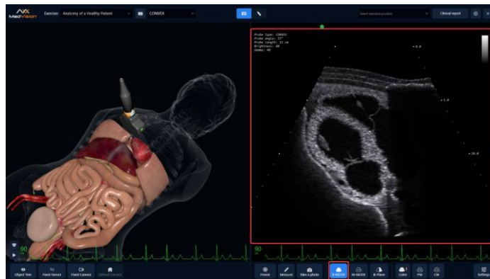
Рис.2. Изображения УЗИ и идентификации анатомических ориентиров

устройства тактильной обратной связи, такие как джойстики с силовой обратной связью или роботизированные руки, для имитации тактильных ощущений при манипулировании ультразвуковым датчиком. Такая обратная связь повышает реалистичность обучения и помогает обучающимся развить необходимые двигательные навыки и ловкость.